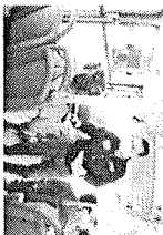
El alcaide Heriberto Treviño Carril, encabezó un grupo de funcionarios de la municipalidad, en un momento de trabajo social que se desarrolló en el Hospital General de San Juan, con el propósito de visitar a los usuarios de este centro de salud y brindarles apoyo emocional y económico.

El día martes 25 de abril, el alcaide de la ciudad de San Juan, Heriberto Treviño Carril, encabezó un grupo de funcionarios de la municipalidad, en un momento de trabajo social que se desarrolló en el Hospital General de San Juan, con el propósito de visitar a los usuarios de este centro de salud y brindarles apoyo emocional y económico. El alcaide se reunió con los usuarios y les expresó su preocupación por su situación económica y emocional, y les ofreció su apoyo y el de la municipalidad. El alcaide también les ofreció el programa social "Por Ellos de Corazón", que es un programa de apoyo emocional y económico que se desarrolla en el Hospital General de San Juan, con el propósito de brindar apoyo a los usuarios de este centro de salud.